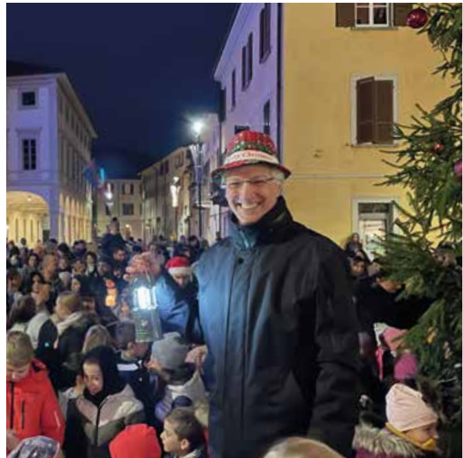
Accensione albero di Natale