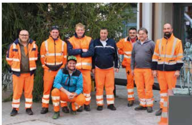
I Collaboratori della squadra esterna

Per l'edilizia privata occorre tenere conto che lo spazio di manovra comunale si è assottigliato nelle prime fasi di presentazione delle domande di costruzione o notifiche varie, mentre è sempre più complesso l'intervento delle autorità cantonali chiamate a formulare i propri preavvisi o nelle trattazioni di ricorsi e opposizioni che costringono l'ente pubblico a dotarsi di consulenti esterni.