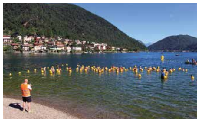
La Traversata Popolare del 10 luglio 2022

mo per terminare, hanno visto, anche grazie alla bella stagione una primavera e un'estate movimentata all'insegna di serate cinema, concerti, eventi sportivi. Il Lido, complice la nuova gestione, ha visto il ritorno della popolazione e delle famiglie. In questo settore è stata rilevante la comunicazione attraverso il nuovo sito internet dedicato al Lido www.lidorivasanvitale.ch .