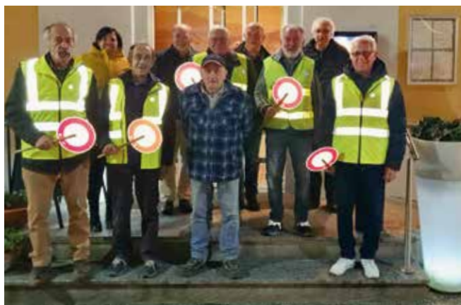
Alcuni dei pattugliatori volontari.

L'accompagnamento dei bambini nel percorso casa-scuola è un punto importante nella garanzia della sicurezza. In concomitanza con l'inizio della nuova legislatura e con l'ausilio di un questionario indirizzato alle famiglie si è voluto comprendere meglio i flussi degli allievi da e per la scuola. Da qui l'implementazione della sorveglianza dei passaggi pedonali e delle zone più a rischio attraverso la presenza di pattugliatori volontari i quali, dopo un'adeguata formazione, hanno iniziato la loro attività di vigilanza degli attraversamenti stradali. Grazie a queste persone, che i bambini ormai riconoscono e apprezzano, si è raggiunto il numero ragguardevole di 16 persone.