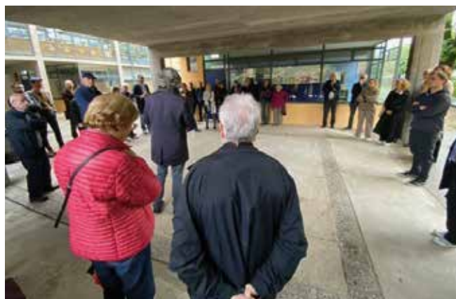
Giornata Speciale, ottobre 2022