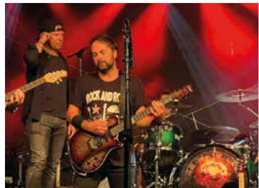
Festa di fine estate: Vasco Jam