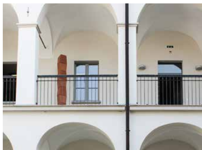
L'opera installata presso il Palazzo Comunale

A testimonianza del valore delle Fornaci e dell'interessamento di numerosi artisti che negli anni hanno valorizzato l'argilla prodotta, dal 23 maggio è possibile vedere presso il Palazzo Comunale l'importante opera scultorea dell'artista Pierino Selmoni "Colonna 1 su 2" realizzata nel laboratorio di Marino Mantegazzi e donata al Comune dal figlio Paolo. Questa opera sarà in seguito collocata alle Fornaci al termine dei lavori di ristrutturazione.