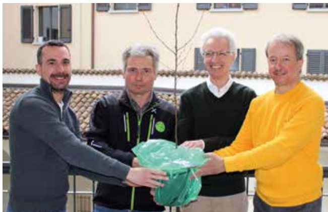
Consegna del Carpino Nero al Municipio e Ufficio tecnico

Il progetto approvato dal Consiglio comunale in data 19 gennaio 2022 ha trovato il suo avvio durante l'estate di quest'anno. Grazie all'intervento delle ditte incaricate dal Municipio e con il supporto della Sezione forestale cantonale, sono state rimosse una parte delle alberature con la sistemazione degli alberi pericolanti e/o sradicati a cui seguirà la messa a dimora di quasi mille nuovi alberi. (MM no. 10-21).