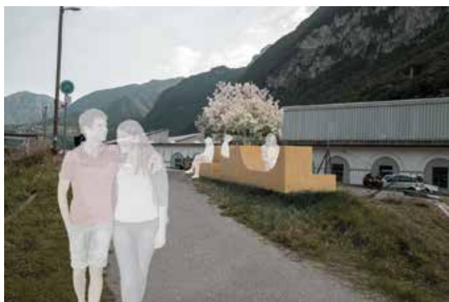
Passaggio pedonale sul Laveggio

L'intento è quello di migliorare la fruibilità pedonale lungo il fiume Laveggio partendo dal Comune di Stabio fino alla foce di Riva San Vitale. L'anno del Laveggio previsto nel 2023, caratterizzerà la fine di questo progetto con una serie di eventi per la popolazione.