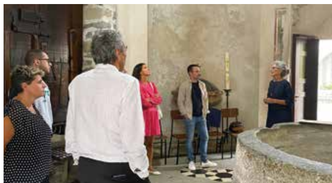
La visita al Battistero