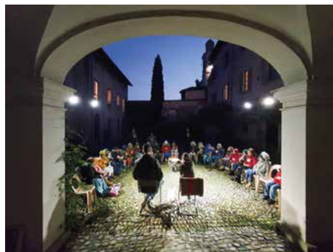
La Notte del racconto

Scegliamo con cura le parole per avere buoni fatti!